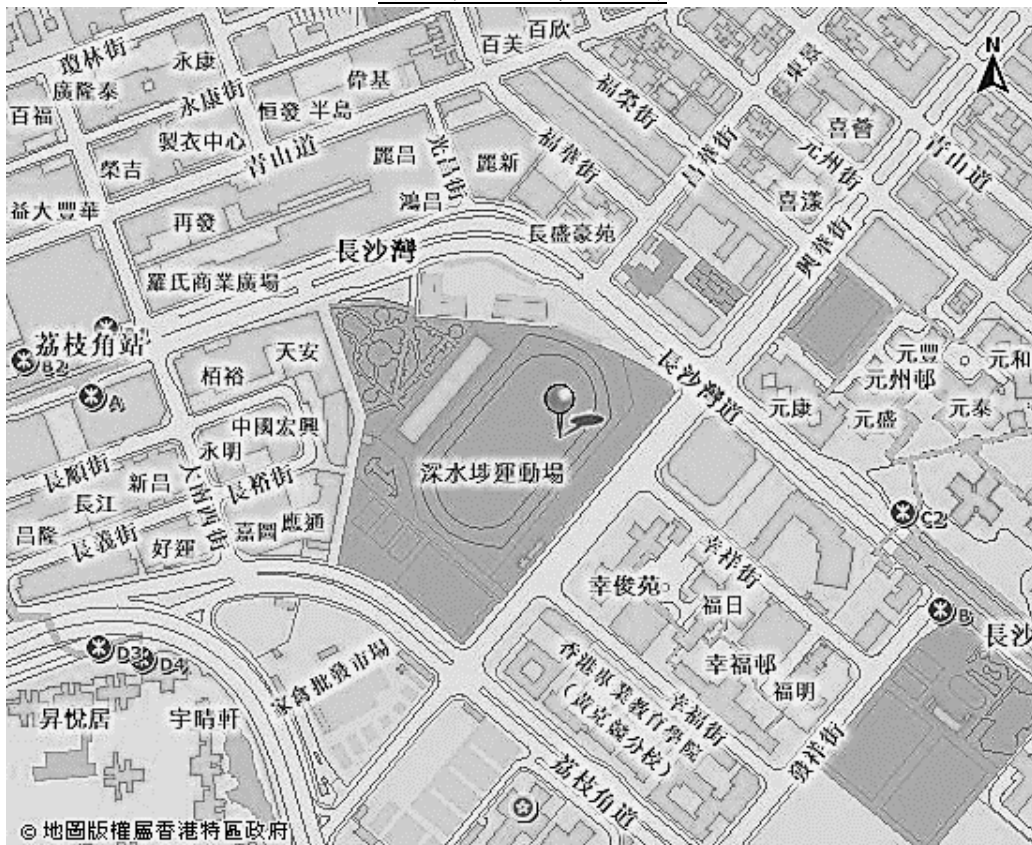
深水埗運動場位置圖